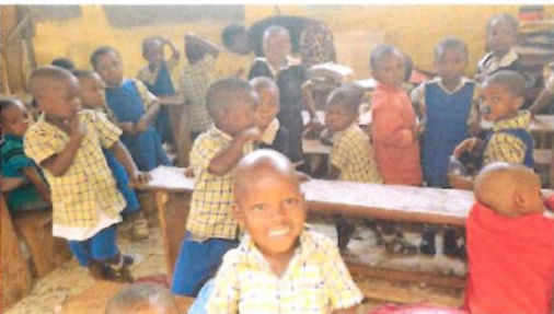
Klassenraum vor der Sanierung