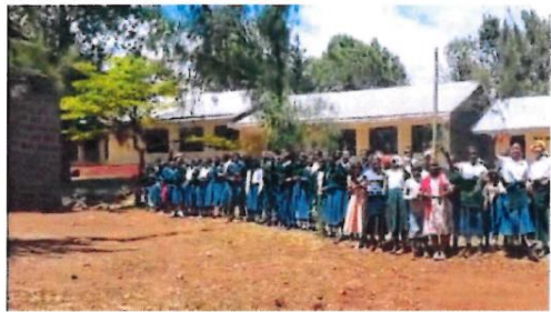
Empfang durch die Schüler/-innen